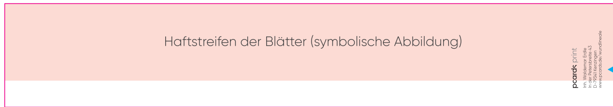
Block-Rückseite in Originalgröße

Alle Felder, Meßskala etc. dienen lediglich als Gestaltungsvorschlag und können komplett nach eigener Vorstellung gestaltet werden.